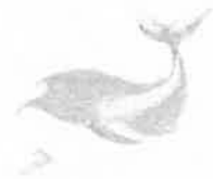
とかしきーケラ丸くん