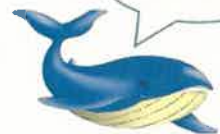
とかしきーケラ丸くん