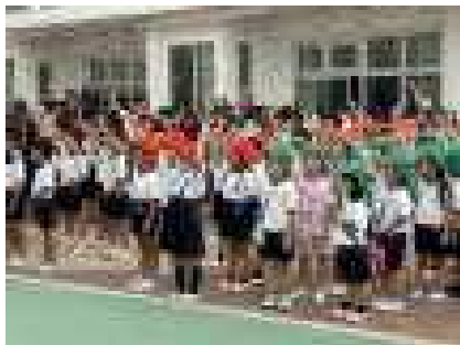
【紅組・幼稚園応援】