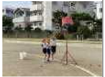
【一年生練習の様子】