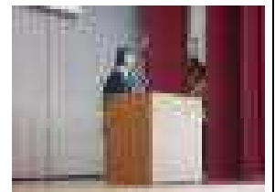
【児童代表あいさつ】

とプラス「あいさつ」で更にパワーアップしていきましょうという話をしました。「実りの秋」となるよう屋良っ子が一つになって一生懸命に取り組む学期としたいと思います。