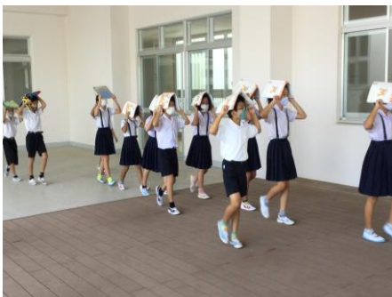
【頭を保護して避難する様子】

11月10日(火)~12日(木)の三日間、新校舎では初めての避難訓練が実施されました。