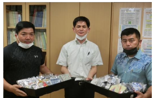
【左は安谷屋会長、右は石嶺副会長】

配布の仕方については校内で検討し、有効活用したいと思います。ありがとうございました。