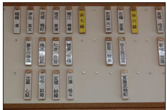
1階廊下の壁面に合格者を掲示