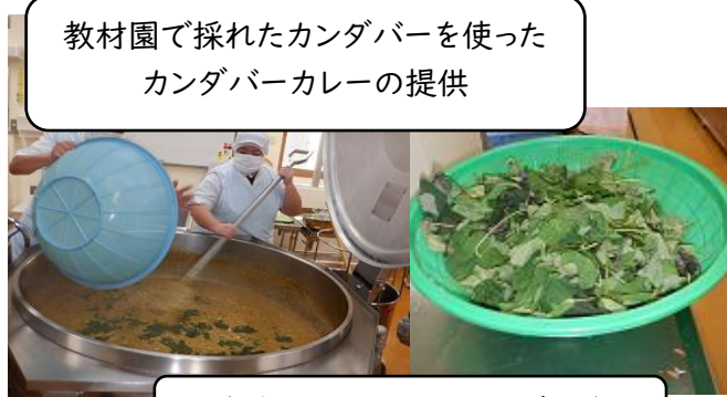
給食週間:給食ができるまでを知ろう